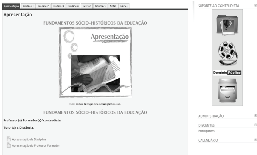
Figura 2 – Sala pré-diagramada formato geral

Logo que o professor formador/conteudista entra na sua sala virtual para começar sua produção intelectual, no formato particular, como mostrado na Figura 3, encontra à sua disposição, diversos atributos do Google docs , no formato texto compatível com o documento Word , como suporte de: fazer downloads , ver histórico de revisões, colar/selecionar, exibir barra de ferramentas de equações, compactar controles, inserir imagem, links , desenhos, notas de rodapé, formatação da letra, ferramenta de tradução, comentários, dentre outras. Além da ferramenta texto, o pacote do Google docs incorporado à sala virtual Moodle , inclui planilha de cálculo, apresentação de slides , criação de formulários online . Os documentos, no modo comentário, remetem ao email dos inclusos no arquivo de edição, todos os comentários realizados. Enquanto o professor formador/conteudista está produzindo sua disciplina, o revisor e o diagramador estão acompanhando em tempo real essa produção. No momento em que o professor liberar para revisão e diagramação, os profissionais envolvidos saberão onde e o que corrigir e ajustar. É a convergência midiática trazendo a um só ponto a produção intelectual. O professor formador/conteudista irá produzir sua disciplina, elabora as atividades avaliativas utilizando as próprias