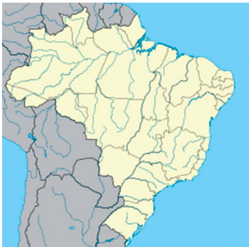
Figura 2: Localização de Pelotas no mapa do Brasil.

Embora haja no município a Associação de Cultura Nippo-Brasileira de Pelotas e uma pequena comunidade de imigrantes (NIPPO, 2020), a iniciativa da irmandade não ocorreu pelos vínculos entre tal comunidade e suas cidades de origem. Como veremos adiante, a irmandade com Suzu foi facilitada por um cidadão pelotense cuja trajetória cultural e profissional favoreceu tal aproximação.