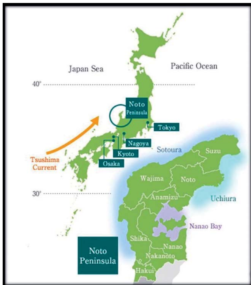
Figura 3: Localização de Suzu no mapa do Japão.

A economia de Suzu baseia-se na agricultura (arroz de terras úmidas, cogumelos matsutake, carvão e outras culturas), pesca comercial, rebanho (Noto Beef ), cerâmicas, sal e saquê (SUZU CITY, 2022a). As atividades turísticas na cidade são estimuladas pelas exuberantes paisagens, Ilha Mitsukejima e outros destinos, tanto perto do mar, como Maho Beach, quanto por trilhas na natureza, como Misaki Nature Trail (SUZU CITY, 2022c).