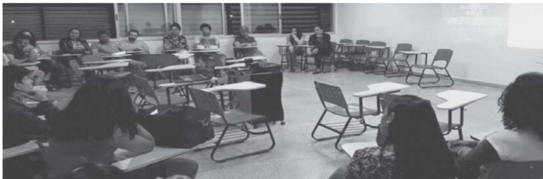
Figura 1 - Roda de discussão após exibição de "As sufragistas", em 14 de setembro de 2017.