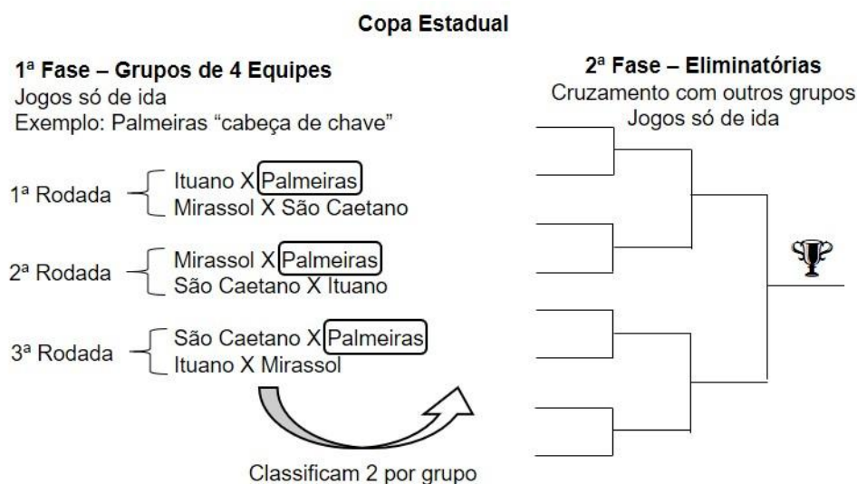
Figura 1. Exemplo da Copa Estadual de São Paulo. Elaboração do autor.

A quantidade de clubes grandes em cada estado definiria a quantidade de grupos na respectiva copa estadual. A Figura 1 demonstra um exemplo do que poderia ser a Copa Estadual de São Paulo, replicável com as adaptações necessárias nos demais estados do Brasil. Neste exemplo, o Palmeiras seria o cabeça de chave e somente jogaria na casa dos adversários na primeira fase. Entre os clubes pequenos, cada um teria dois jogos em casa, sendo um contra o clube grande do grupo e outro jogo fora de casa.