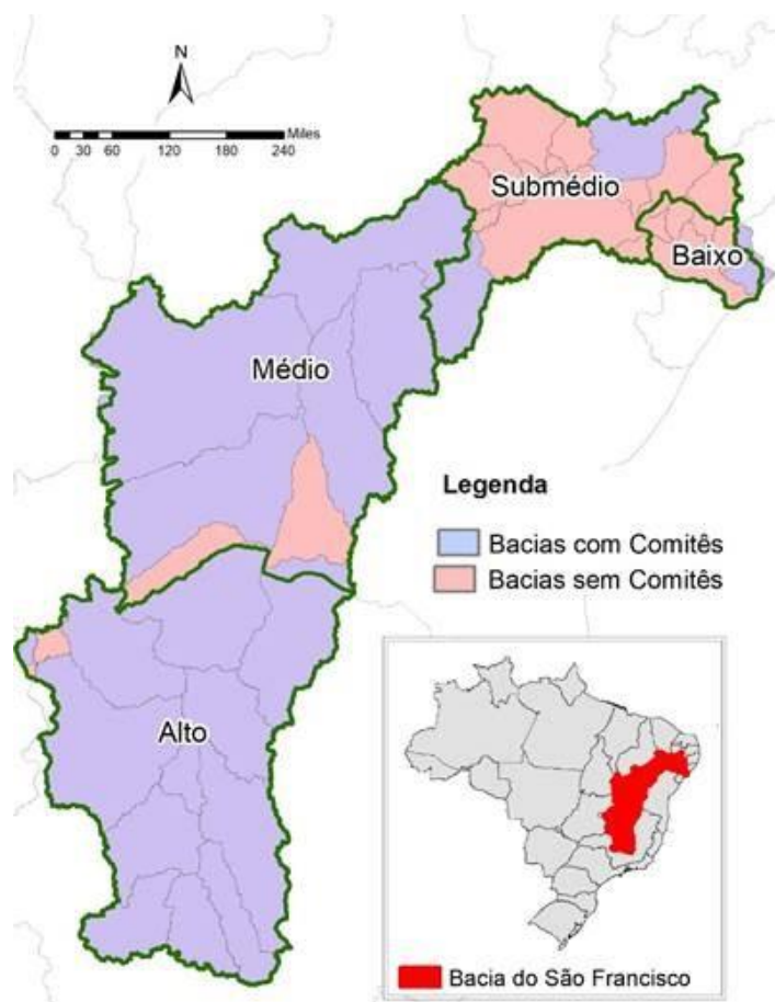
Figura 1. Divisão Fisiográfica da bacia hidrográfica do Rio São Francisco.

A bacia hidrográfica do São Francisco está localizada entre 7° e 21° de Latitude Sul e 35° a 47° de Longitude Oeste, abrangendo 639.219 km 2 , com vazão média registrada em 2018, de 1.311,00 m 3 /h que chegam ao oceano Atlântico 1 . Sendo composta pelo leito principal, por 34 sub-bacias, por 168 afluentes e dividida em quatro regiões fisiográficas: Alto São Francisco, com 16% da área da bacia; Médio São Francisco, com 63% da área da bacia; Submédio São Francisco, com 17% da área da bacia; e Baixo São Francisco, com 4% da área da bacia (SANTANA, 2010), como mostra na Figura 1.